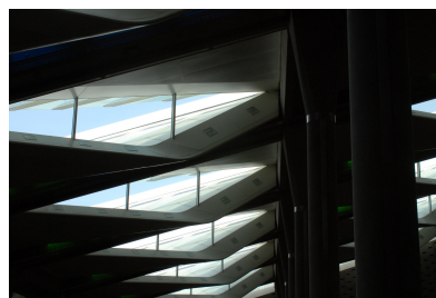
© Hofer ZT GmbH & Co ZT KG